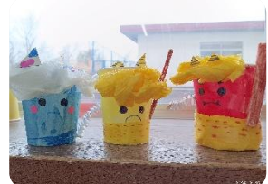
かわいい鬼さん豆入れができました。お家の鬼退治もこれでばっちりOK!!

2年生になると、支援員による、玄関でのお迎えが無くなります。そこに向けて、お迎え方法を 2月17日(月) から声掛け確認のみに変更し、一人で登所する練習をしていきたいと思ひます。毎日、欠席なのか利用なのか…迷う子もまだ多く見られます。家庭で毎朝、学童の利用・欠席を必ず伝えるようにしましょう。