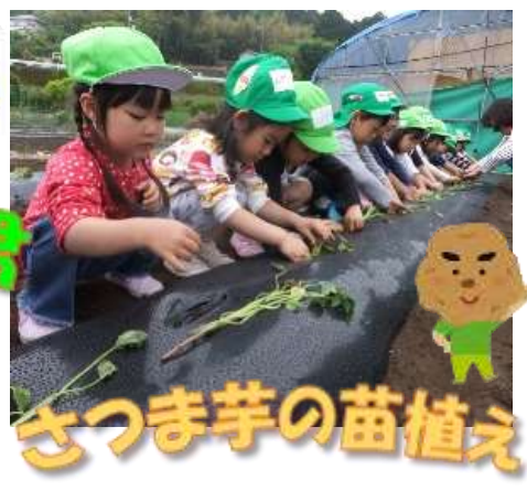
さつまい芋の苗植え