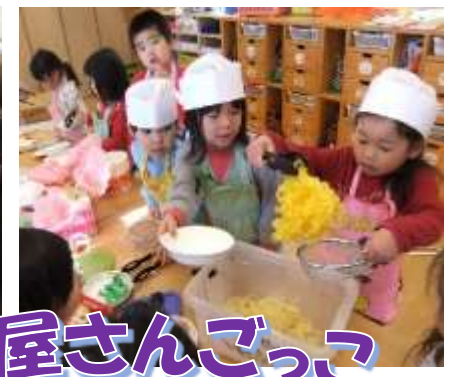
お店屋さんごっこ