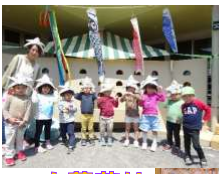
さつまいも苗植え