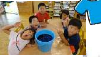
おそろいのTシャツづくり