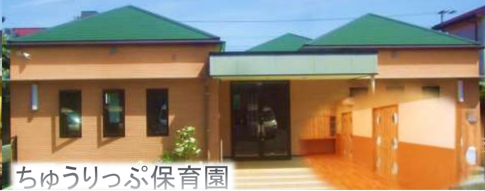
ちゅうりっぷ保育園