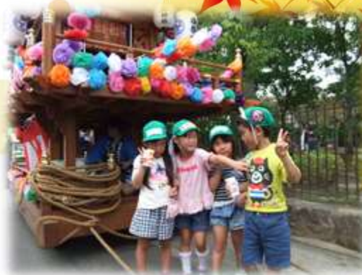
吉田区のお祭りに 参加しました

「ヨシダ ノ ワケーシュー タノムゾー サンヤレ サンヤレ…」山車をひかせてもらいました。