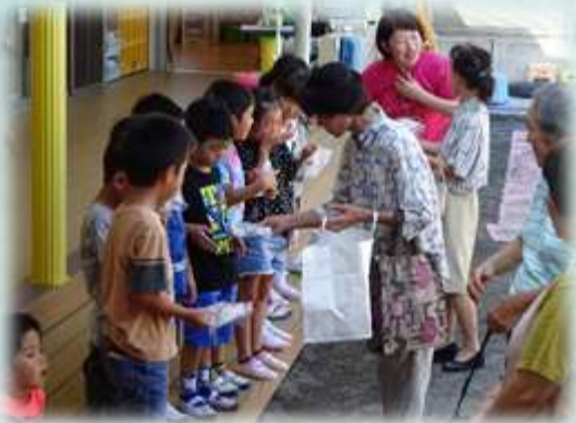
「花飾人」のみなさんに ポプリをいただきました

花と緑のボランティアグループ「花飾人」のみなさんが園を来訪し、さくらの里で育ったラベンダーのポプリをいただきました。ありがとうございました。